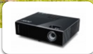
ACER HD Projektor