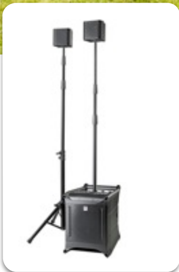
HK Audio Sound System